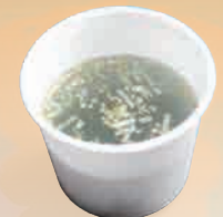
特製わかめスープ